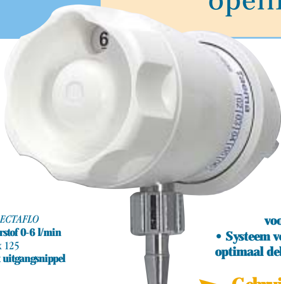
1 SELECTAFLO zuurstof 0-6 l/min 12 x 125 met uitgangsnippel