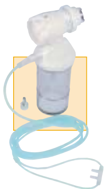
SELECTAFLO zuurstof met bevochtiger en zuurstoftherapiebril